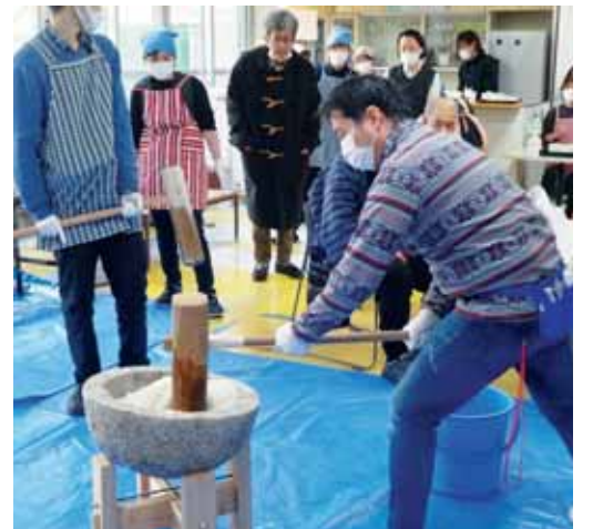
▲よいしょーの掛け声に合わせて