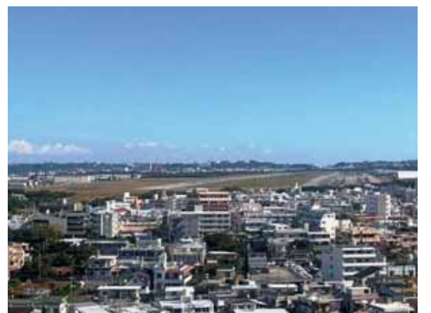
▲住宅地の中にある普天間基地 (真ん中の緑の部分)

2025年1月17日から19日まで、沖縄ヘフィールドワークに行ってきました。前年の7月から岡山県民連の「平和ゼミナール」へ参加し、毎月1回、同世代の仲間たちと人権や平和について学びを深めてきた集大成です。沖縄戦の歴史や米軍基地のことについて事前学習も行ってきました。1日目は、沖縄戦をテーマに学ぶため「南風原豪邸」や「糸数アブラガマ」などへ行きましました。実際に豪邸の中に入り、当時の状況をイメージし、たどきに言葉にできないような恐怖を感じました。ここではひめゆり学徒隊が傷病兵の治療にあたったこと、その当時14歳ほどの学生が親元を離れ、薄暗く不衛生な環境下で戦争の手伝いをさせられていたと考えると悲痛な思いでした。