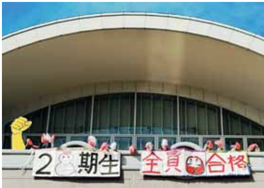
▲3年生を見送る1年生

春のような暖かさの2月15日、1年生や実習病院の方々、また教職員に見送られ3年生は第114回看護師国家試験に出発しました。