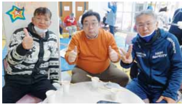
▲おいしいお餅に大満足

新型コロナ感染症が流行して以来、飲食を伴うイベントの自粛・縮小が続いていたため、このイベントは、デイケア利用者さんとスタッフが楽しみながら交流を深める貴重な機会となりました。