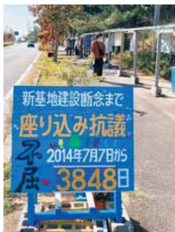
▲辺野古テント村に立てられた看板