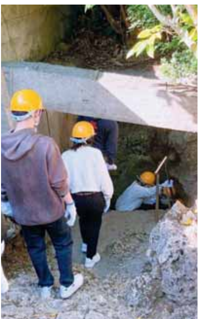
▲糸数アブラガマの入口