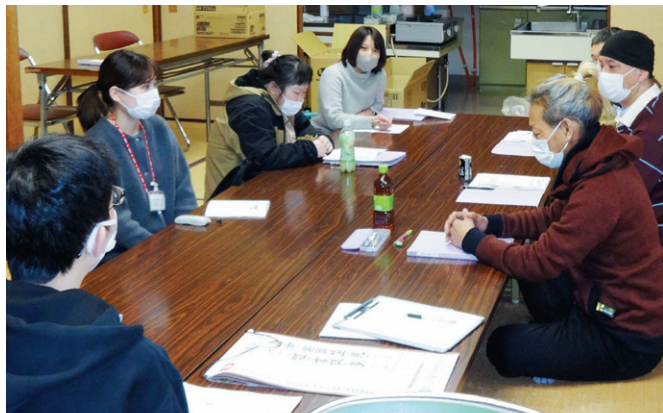
▲デイケアでの懇談の様子

林病院の医師研修 林病院では毎年10名前後の初期研修医(※)の研修(1、2ヶ月)を受け入れています。また、精神科を志望する医師の専門研修(後期研修)も受け入れています。