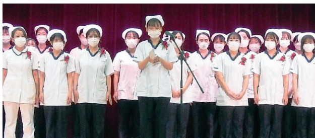
▲卒業生のお礼の言葉

で何ができるのかを模索しながら常に生活様式が変化し続けてきました。初めての実際においても同様に感染症の影響を受け、学内での実習となりました。そのような環境でも、仲間と協