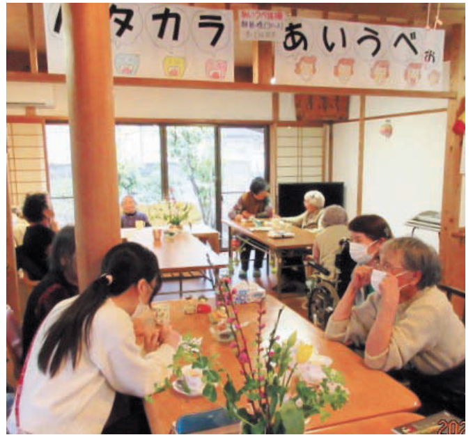
▲和やかな雰囲気のカフェ

2023年度は新型コロナウイルス感染症も5類感染症になりました。臨地での実習を行いました。患者様に出会う事で、患者様の思いに沿った看護をする大切さを学ぶことができました。これから卒業生達は、看護の道を歩みますが、さらなる研鑽を積み、素晴らしい看護師に成長し活躍されることを、心より祈念します。