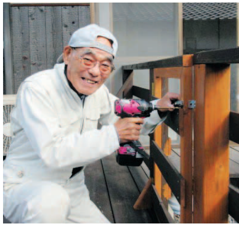
▲大工仕事はお手のもの

グループホームひだまりの家で2023年8月から月に1度開催している「ひだまりの家フェ」。地域の方々がもつとグループホームを身近に感じ、困った時に相談できる拠り所となる事を願い、立ち上げた認知症カフェです。これまでも、地域の方だけでなく、近隣施設の方や包括支援センターの方など、多くの方が訪れてくれました。今では、入居者の皆さんと地域の方が