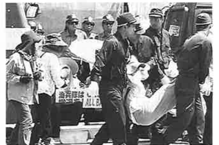
▲強制排除される参加者

8月3日、民医連の派遣による「新基地建設反対! 辺野古座り込み行動」に参加した。高速道路を北上する事約1時間、本土にいるのとあまり大差ない風景の市街地を離れると、ドラマや写真で見た事のある、沖繩らしい家屋や風景が増え、海線はとも美しく、ここで全島民を巻き込んだ戦争があった事とも信じられない。現地は、基地の出入りの道路を隔てた対面沿いに、手作りのテントが数十メートルほど連なっており、その中に参加者が待機している状態だった。ほとんどが高齢の方々ばかりで、若い部類に入るのは、報道や支援者のひと握りのグループだけである。