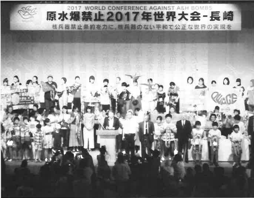
▲6,000人が参加した開会総会

8月7日から9日まで長崎で行われた「原水爆禁止2017年世界大会」に参加してきました。この大会は毎年8月に広島と長崎の両被爆地で開かれています。今年7月に核兵器の全廃を目的とする核兵器禁止条約が国連会議で採択されて初となる今回は、特別な意味を持つものとなったのではないのでしょうか。そういう訳もあってか、会場には収まりきれないほどの参加者とその方々の平和への熱い思いに、初めて参加した私は圧倒されるばかりでした。2日目には、爆心地周辺に残されている多くの被爆遺構や碑を見学し、被爆体験を聞き、ガイドと一緒に巡ることに。核兵器廃絶を求める方々の心に触れ