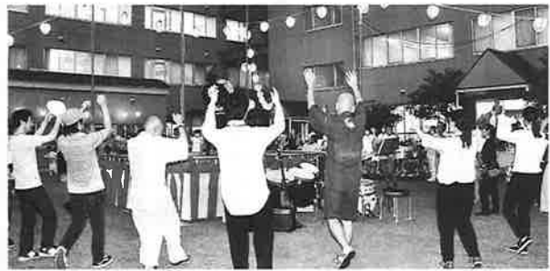
▲やぐらを囲んでみんなで盆踊り

アートなど模擬店9店舗の紹介でスタートし、鳥城楳鼓遊会による「アジアの海賊」と「明日に向かって打て」の2曲の大鼓演奏が行われました。途中、患者さん有志による太鼓演奏や、町野医師による篠笛と鳥城楳鼓遊会とのコラボ演奏も実現しました。そして、中2病棟職員有志によるバンド演奏の後、平和へのメッセージを短冊に載せた風船が一同に上げられ、歓喜の中で夏祭りは終了しました。